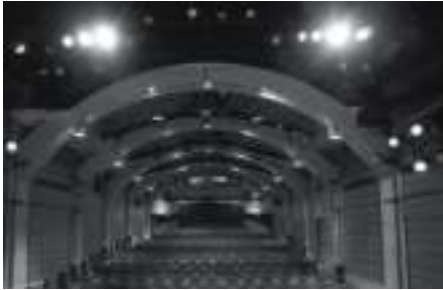
Théâtre du Vieux-Colombier