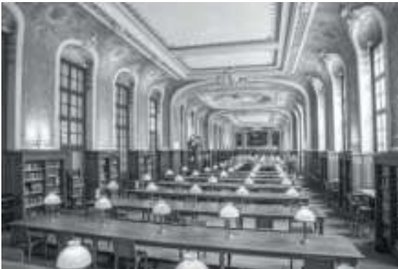
Bibliothèque de la Sorbonne